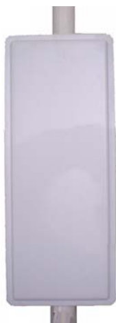
Антенна RFE 2400/90/14H

Секторная антенна RFE 2400/90/14H предназначена для построения сетей передачи данных стандарта IEEE 802.11b/g. Используется в составе базового оборудования.