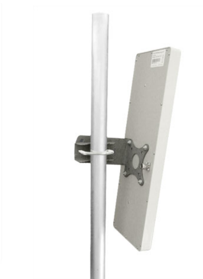
Антенна RFE 2300/60/15

Секторная антенна RFE 2300/60/15 предназначена для построения сетей передачи данных. Используется в составе базового оборудования.