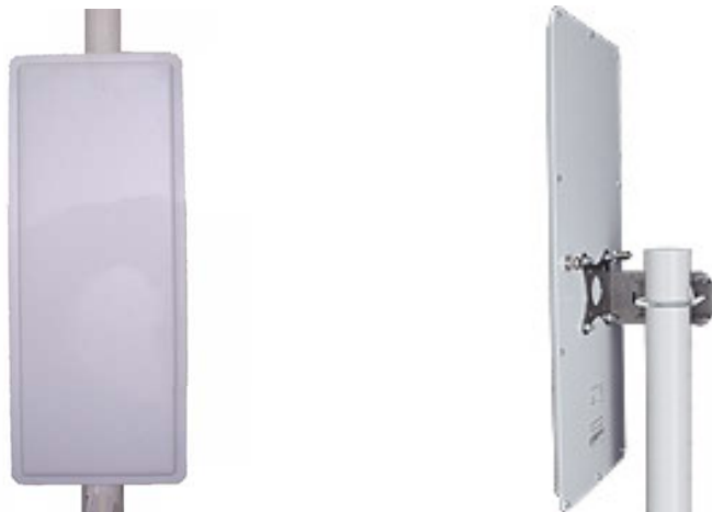
Антенна RFE 2300/90/14H

Секторная антенна RFE 2300/90/14H предназначена для построения сетей передачи данных стандарта IEEE 802.11b/g. Используется в составе базового оборудования.