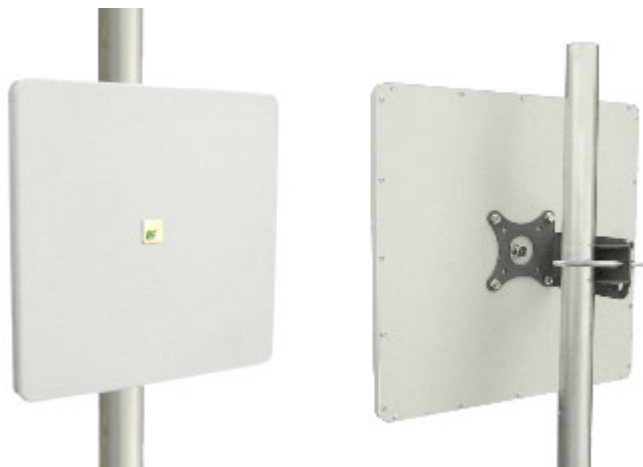
Антенна RFE 2700/19

Панельная антенна RFE 2700/19 предназначена для построения сетей передачи данных. Используется в составе базового оборудования.