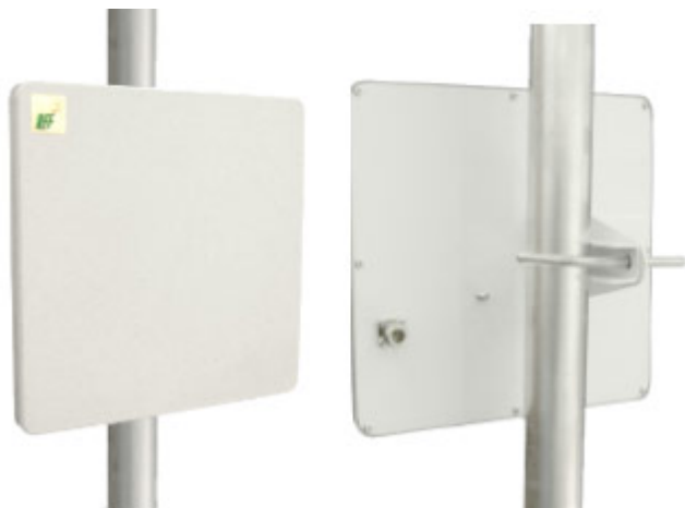
Антенна RFE 5800/20

Панельная антенна RFE 5800/20 предназначена для построения сетей передачи данных. Используется в составе базового оборудования.