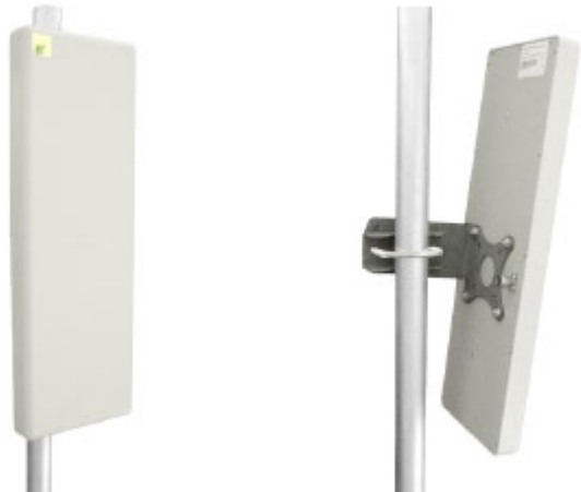
Антенна RFE 6300/60/18H

Секторная антенна RFE 6300/60/18H предназначена для построения сетей передачи данных. Используется в составе базового оборудования.