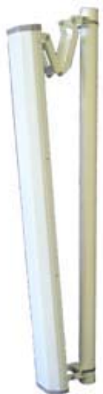
Антенна RFE 2700/60/18MIMO

Секторная антенна RFE 2700/60/18MIMO предназначена для построения сетей передачи данных стандарта IEEE 802.11b/g. Используется в составе базового оборудования.